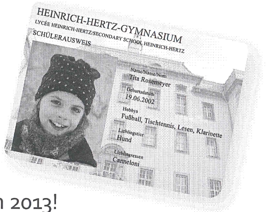
Designs von 2013!