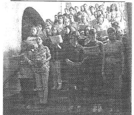
„Yesterday“ - Eine Vorführung des Chors

Insgesamt waren die letzten Tage doch sehr schön, hoffentlich wird die nächste Projektwoche wieder so.