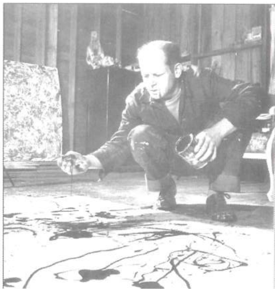
Pollock bei der Arbeit

Alkoholismus bei einem Autounfall. Er war einer der größten abstrakten Expressionisten und Action Painter seiner Zeit. Seine Werke setzten neue Maßstäbe und haben bis heute keinen einzigen Funken an Faszination und